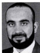
ハリド・シェイク・モハメド

また、94年から95年にかけて、ク ウェート国籍の「アルカイダ」ナンバー 3、ハリド・シェイク・モハメド、お よびその甥のラムジ・ユーセフ(93年2 月に起きたニューヨーク世界貿易セン タービル爆破事件の首謀者)がマニラ首 都圏に「アルカイダ」の細胞を構築し ていた時期に、両人は「バリク・イス ラム」のリクルート活動を側面から支 援した(ハリドはその後、01年の米同時テ ロ〔「9・11テロ」〕で実行犯とビン ラーディンを繋ぐ「オルガナイザー」と なったが、03年3月にパキスタン国内 で逮捕され、現在は米治安当局の拘留下 にある。ラムジは米国内で終身刑判決を 受けて服役中)。